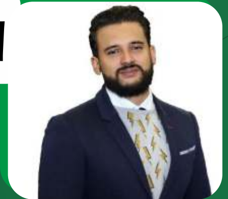
INTI RAÚL ASPRILLA REYES

Nació en Bogotá, el 9 de octubre de 1981. Es abogado de la Universidad los Andes con Maestría en Derecho Internacional Económico de la Universidad de Ginebra (Suiza), donde se graduó con mención especial por su tesis sobre 'Fusiones y Adquisiciones'. En la actualidad se desempeña como Representante a la Cámara por Bogotá, espacio desde el cual ha liderado la defensa de derechos de grupos poblacionales afectados por diversas medidas de la administración distrital; los habitantes del sur de la ciudad afectados por el relleno sanitario Doña Juana, vendedores informales, motociclistas, todo ello sin descuidar el resto de problemáticas que aquejan a los ciudadanos capitalinos en materia de convivencia, movilidad y seguridad.